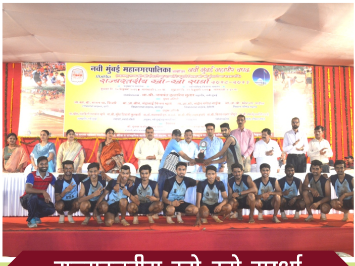
राज्यस्तरीय खो-खो स्पर्धा