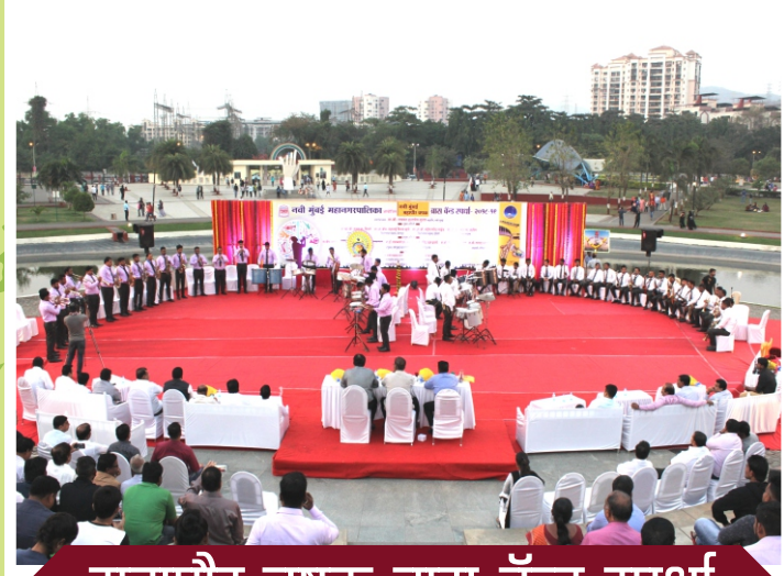
महापौर चषक ब्रास बॅन्ड स्पर्धा