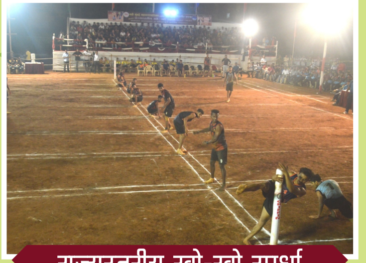
राज्यस्तरीय खो-खो स्पर्धा