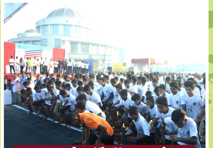
महापौर मॅरेथॉन स्पर्धा