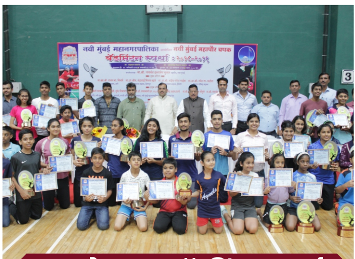
महापौर चषक बॅडमिंटन स्पर्धा